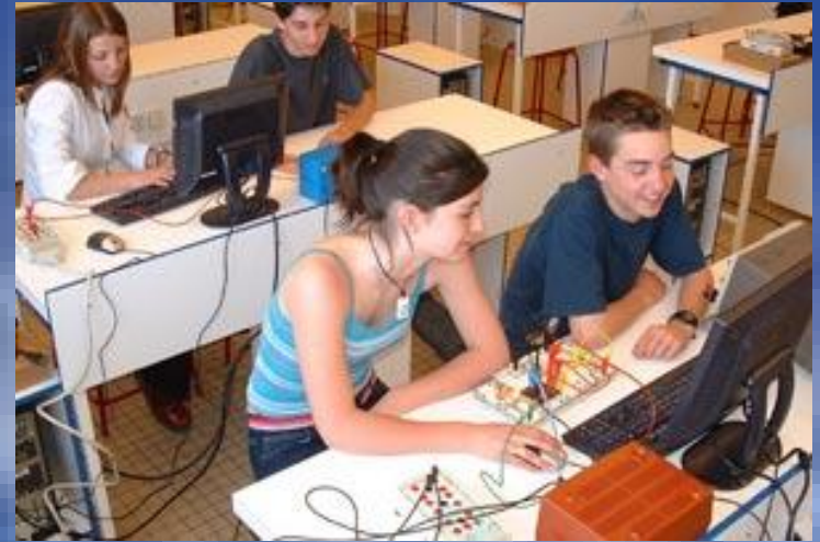
Sciences de l'ingénieur